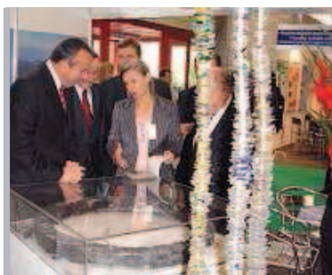
Ungarische Minister staunen über die vielen Aktivitäten.