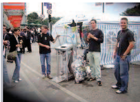
Freude an der Schweizer Dosenpresse in Ungarn.