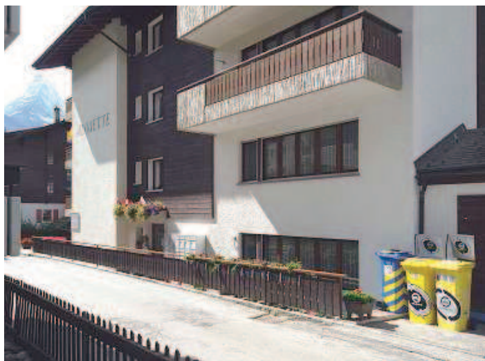
IGORA-Sammelbehälter beim Ferienhaus Alouette in Zermatt.